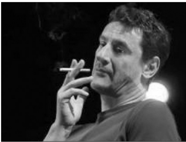
Giorgio Tirabassi in "Coatto unico"