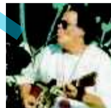
Louisiana Red al Big Mama dalla sera di Santo Stefano

La «macchina blues» di Louisiana Red torna a infiammare il pubblico del Big Mama con una serie di concerti che ormai costituiscono una delle consuetudini più amate nella programmazione della «Casa del blues» di Trastevere. Da venerdì 26 al 28 dicembre e poi nella notte di Capodanno il grande bluesman accompagnerà il pubblico in una serie di session musicali a cui parteciperanno anche ospiti a sorpresa (negli anni scorsi Alex Britti).